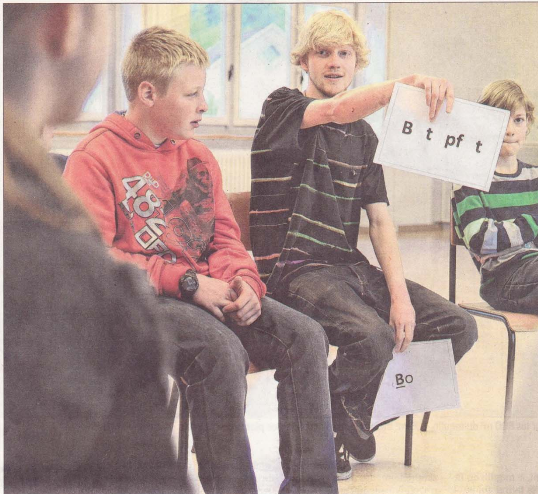
Réunis dans l'aula de l'école, les élèves ont bénéficié des conseils de l'artiste Koqa. VINCENT MURITH